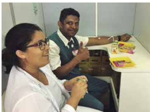
Voluntários doam sangue para Hemonorte