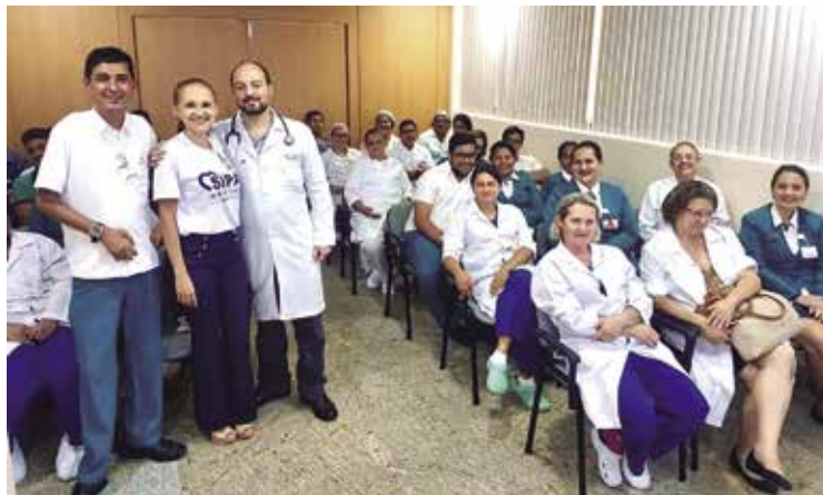
Calendário de Vacinação – palestra do infectologista André Luciano